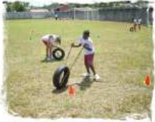
Roue loto de Mayotte en Martinique