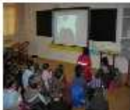
Lot et Garonne