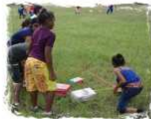
Hfira du Maroc en Nouvelle Calédonie

Avec un relais (ballon) et une banderole