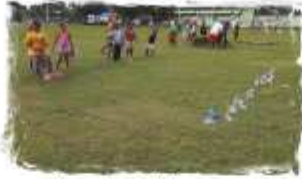
Le massakré de Guadeloupe en Polynésie

Pour pratiquer des sports d'autres territoires