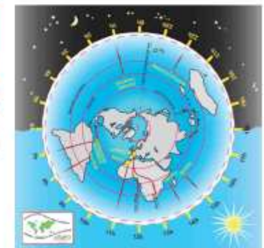
Le fusOcéan permet de connaître l'heure sur les territoires USEP dans le monde

Des rencontres à vivre De classe à classe D'école à école Ou sur un secteur, une zone ou le département